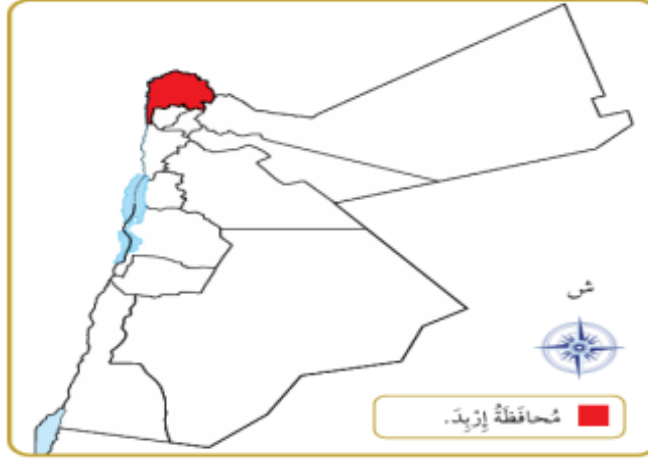
خريطة المملكة الأردنية الهاشمية.

ملاحظة مهمة: خريطة الأردن ص ٦٨ وتعيين محافظة اربد عليها مطلوبة