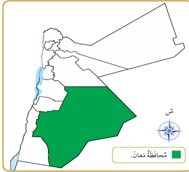
خريطة المملكة الأردنية الهاشمية.

ملاحظة مهمة: خريطة الأردن ص 62 وتعيين محافظة معان عليها مطلوبة