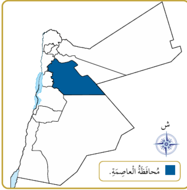
خريطة المملكة الأردنية الهاشمية.

** ملاحظة مهمة: خريطة الاردن ص مطلوبة وتعيين محافظة العاصمة عليها مطلوب